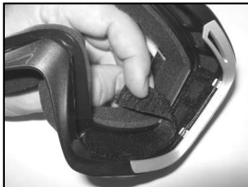
Картинка 2. Отсоедините левую и правую вкладки с липучкой Velcro внутри очков