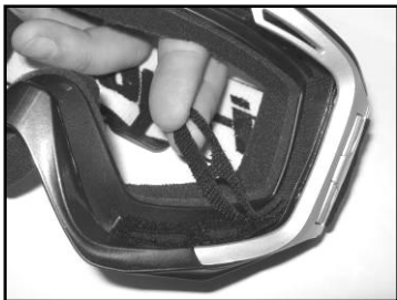
Картинка 3. Установите левую и правую вкладки в соответствии с желаемым уровнем вентиляции