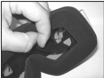
Картинка 4. Процедура установки может быть выполнена изнутри очков без съема линз.